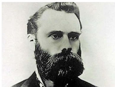
ชาร์ลส์ เฮนรี ดาว (Charles Henry Dow)